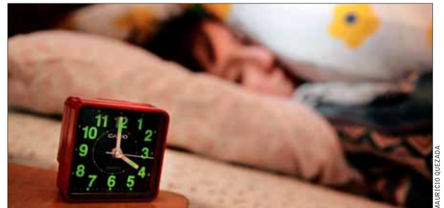
AUMENTO. — En el Centro de Cefalea de RedSalud estiman que las consultas por insomnio y estrés a causa del teletrabajo han crecido en 15%, durante la contingencia.