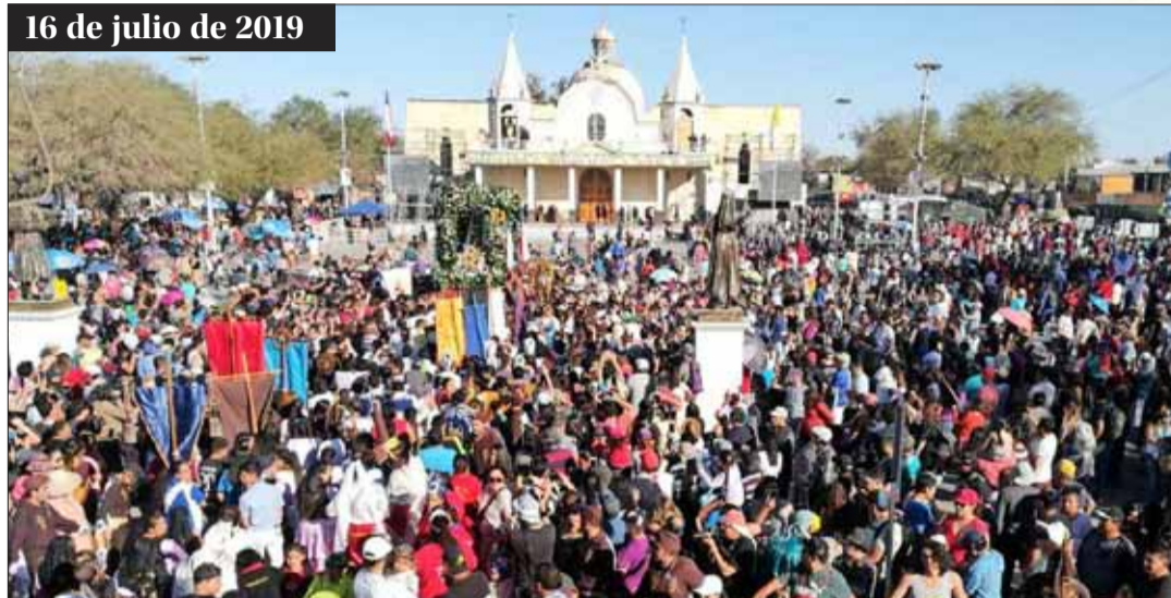
16 de julio de 2019