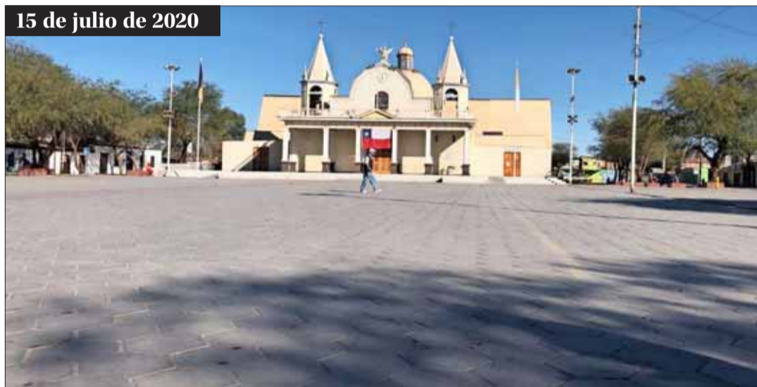
15 de julio de 2020

FERVOR. — El año pasado, unas 300 mil personas llegaron al poblado de La Tirana para venerar a la Virgen del Carmen, conocida también como la "Chinita" por los promesantes. En la imagen, la procesión de la tarde.