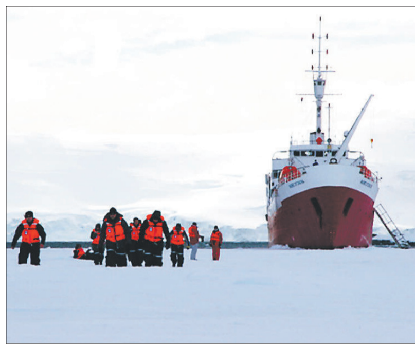
EN EL HIELO.— Aunque cerca del 90% del tiempo se está a bordo del buque, hay desembarcos para visitar estaciones científicas y viajes en zódiac.

La primera travesía del Antarctic Dream al Polo Norte fue un éxito en términos de negocios. Realizaron 8 viajes, movilizando 592 pasajeros, con un pasaje de entre US$ 5.200 y US$ 14 mil. Fue además el único barco no noruego ni holandés entre la veintena de cruceros en esa área,