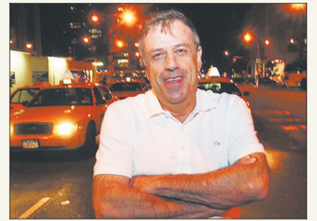
JORGE SCHAULSOHN DESDE N. YORK:

La travesía ártica del Antarctic Dream culminará el próximo 12 de octubre con su arribo a Punta Arenas, donde entrará a dique para preparar la temporada en la Antártica.